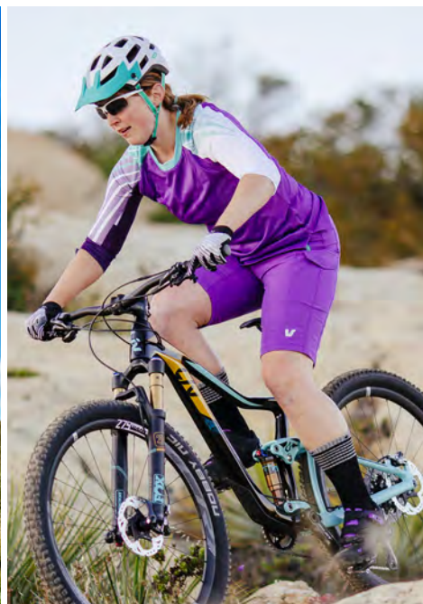
Frauen schätzen das Risiko beim Biken anders ein als Männer. „Unter sich“ fühlen sich viele Bikerinnen deshalb wohler als in gemischten Gruppen.

D ass Männlein und Weiblein mit unterschiedlichen körperlichen Voraussetzungen, aber auch mit verschiedenen Motivationsstrategien an den Sport herangehen, wissen wir seit der letzten SPORTaktiv-Ausgabe, in der wir unsere „Woman“-Serie gestartet haben. Münzen wir das Ganze nun mal aufs Mountainbiken um: Biken Frauen auch anders als Männer? Aber ja! Das heißt freilich nicht, dass sie besser oder schlechter biken.