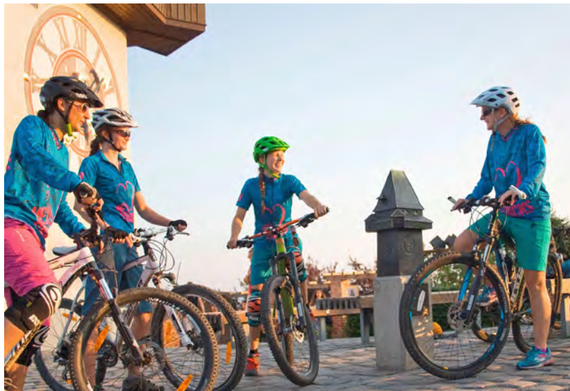
In Ladies-Gruppen oder -Bikecamps können Frauen ohne Leistungsdruck biken und an Grundlagen wie der Kurven- und Bremstechnik feilen.

Die Sache mit der Ausrüstung wäre also geklärt. Und wo sind Bike und Bikerin jetzt für gewöhnlich zu finden? Natürlich draußen! Aber nicht jede Frau tritt gerne alleine in die Pedale. In den letzten Jahren ist vor allem die Nachfrage nach reinen Frauen-Bike-